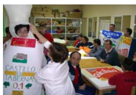
Disfraces y concurso de Carnavales en el Auditorio.