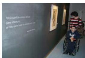
Visita al Centro de Arte Museo de Almería.