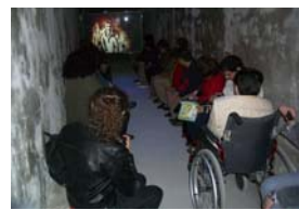
Visita a los recuperados refugios de la Guerra Civil.