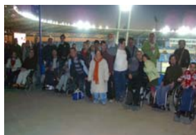
Apoyo al Almería en un emocionante partido de Liga.