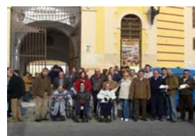
Asistencia al espectáculo de recortadores de Toros